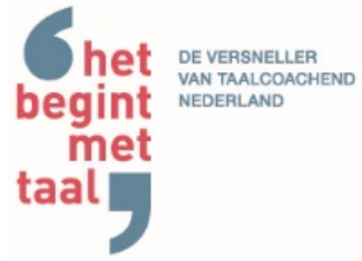
Het Begint met Taal